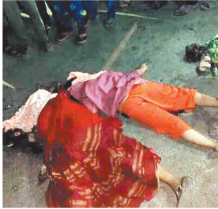
हादसे मृत मां-बेटे का शव।

लापरवाहीपूर्वक वाहन चलाते हुए सड़क पर पैदल चल रहे ग्रामीण को अपनी चपेट में ले लिया। इस हादसे में ग्रामीण की मौके पर ही मौत हो गई। जिसके बाद आक्रोशित ग्रामीणों ने मार्ग पर चक्काजाम कर दिया। जिससे एनएच पर वाहनों की लंबी कतार लग गई थी। वहीं कोरबा-कटघोरा मार्ग दरौं के समीप एक तेज रफ्तार राखड़ लोड ट्रेलर चालक ने स्कूटी सवार मां और बेटे को अपनी चपेट में ले लिया। इस हादसे में मां और बेटे की मौके पर ही मौत हो गई। हादसे के बाद आक्रोशित लोगों ने चक्काजाम शुरू कर दिया। जिसकी वजह से मार्ग पर आवगमन बाधित हो गया। सूचना मिलने पर मौके पर पुलिस चालक को पकड़े और आक्रोशित लोगों को समझाया दी। जिसके बाद लोगों ने चक्काजाम समाप्त कर दिया।