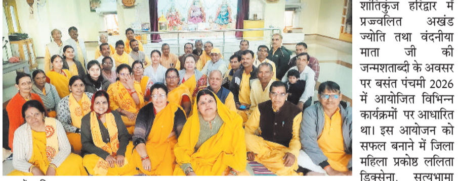
यज्ञ में शामिल श्रद्धालु।

हरिभूमि न्यूज ►► कटघोरा कटघोरा में 51 घरों में एक साथ गायत्री यज्ञ संपन्न हुआ। यज्ञ प्रारंभ रविवार की सुबह 9 बजे से दोपहर 12 बजे तक कटघोरा में अखिल विश्व गायत्री परिवार शांतिकुंज हरिद्वार के सूक्ष्म संरक्षण एवं मार्गदर्शन में आयोजित गृहे गृहे यज्ञ