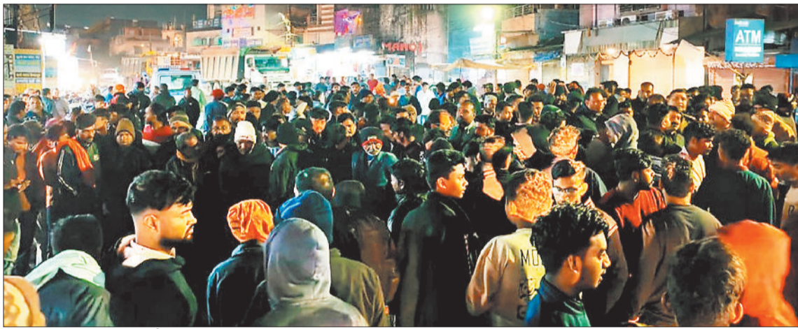
सड़क हादसे के बाद गुस्साएं भीड़ ने किया चक्काजाम।