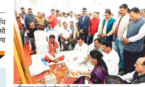
भूमिपूजन करते उद्योग मंत्री एवं अन्य।