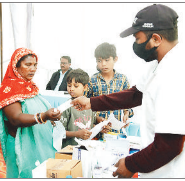
शिविर में स्वास्थ्य परीक्षण करते हुए।

डायग्नोस्टिक्स और फिजियोथेरेपी सेवाओं को प्रभावी रूप से क्रियान्वित किया गया। शिविर के अंतर्गत लाल घाट, चेकपोस्ट, भाद्रापाया, सतनामनगर एवं हाउसिंग बोर्ड कॉलोनी सहित रिसदा क्षेत्र के विभिन्न इलाकों के नागरिकों को स्वास्थ्य सेवाएं प्रदान की गईं। बालको की सामुदायिक विकास टीम द्वारा तकनीकी मार्गदर्शन एवं स्थानीय स्वास्थ्य कार्यकर्ताओं के सहयोग से शिविर में समग्र स्वास्थ्य सेवाएं प्रदान की गईं। इनमें लैब परीक्षण, फिजियोथेरेपी इलेक्ट्रोथेरेपी तथा हॉट कोल्ड फ्लूमेंटेशन द्वारा दर्द प्रबंधन एवं रोकथाम आधारित